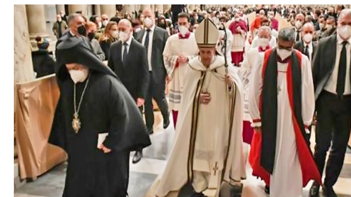
Pope Francis announces an Ecumenical Prayer Vigil, to be held in September prior to the Synod of Bishops, so as to entrust the bishops' work to the Lord.

Addressing the faithful gathered in St Peter's Square for the Sunday Angelus, Pope Francis looked ahead to the traditional Week of Prayer for Christian Unity, which takes place each year from 18 to 25 January.